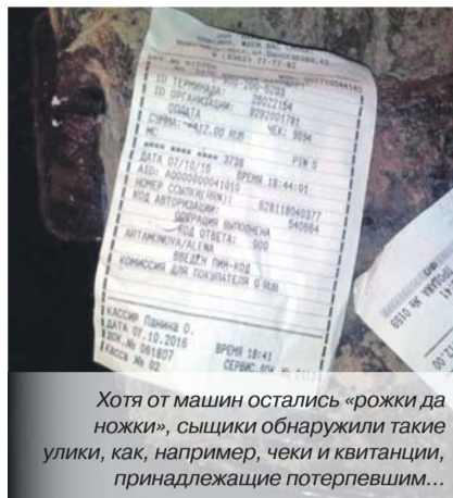
Хотя от машин остались «рожки да ножки», сыщики обнаружили такие улики, как, например, чеки и квитанции, принадлежащие потерпевшим...