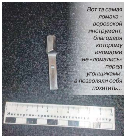
Вот та самая ломача - воровской инструмент, благодаря которому иномарки не «ломались» перед угонщиками, а позволяли себя похитить...