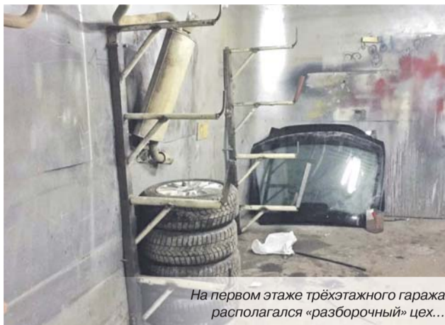
На первом этаже трёхэтажного гаража располагался «разборочный» цех...