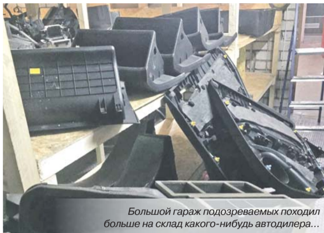
Большой гараж подозреваемых походил больше на склад какого-нибудь автодилера...