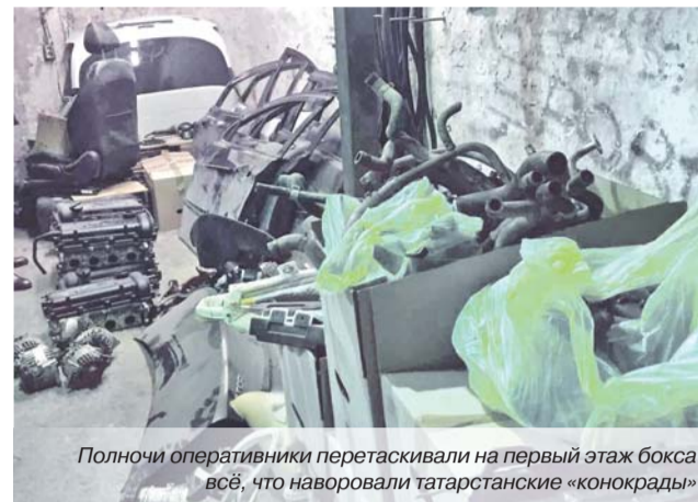
Полночи оперативники перетаскивали на первый этаж бокса всё, что наворовали татарстанские «конокрады»